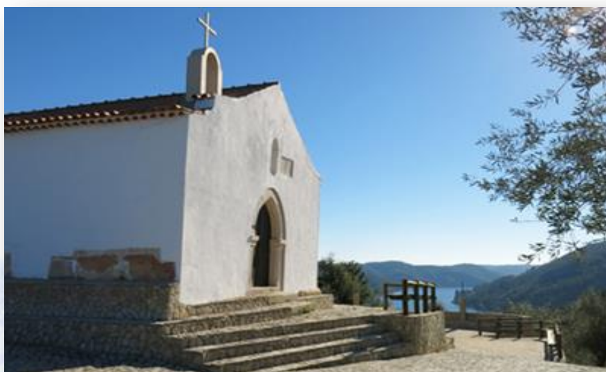
Capela de S. Pedro de Castro - JF Ferreira do Zêzere

Durante todo o percurso da PR3 FZZ – Pombeira podemos observar e disfrutar de uma paisagem deslumbrante, podendo avistar as localidades da aldeia da Pombeira, Zaboeira, Alcamim, a maravilhosa albufeira de Castelo do Bode e as suas límpidas águas, o perímetro do Castro, São Pedro de Castro e a sua capela, Aldeia do Maxial.