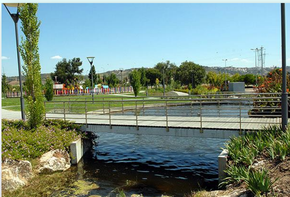
Parque Adão Barata - CM Loures

Utiliza as motas do canal da ribeira da Mealhada, que passa junto ao Parque Adão Barata, até à confluência com a ribeira da Póvoa/Odivelas, junto a Frielas perto do início do Caminho do Povo.