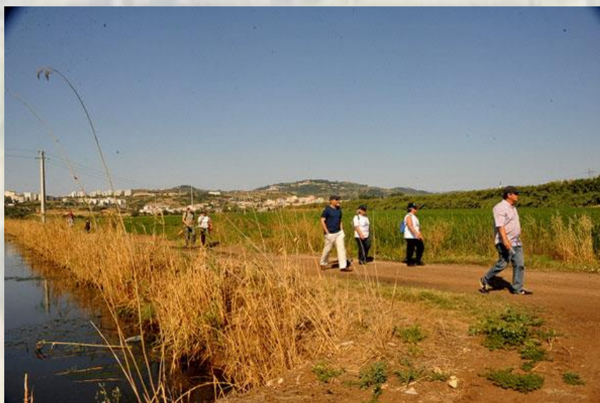
Várzea de Loures - CM Loures

A partir desta ponte segue pela mota direita da Ribeira da Póvoa até à Ponte do Américo e de novo pela mota esquerda até à confluência com o rio Trancão.